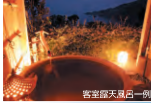
客室露天風呂一例