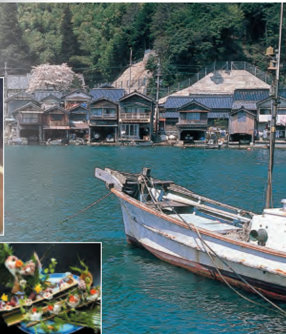
重要伝統的建造物群保存地区 伊根の舟屋