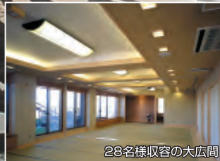
28名様収容の大広間