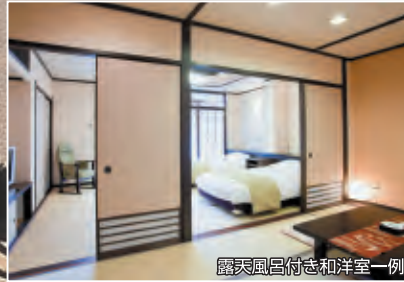
露天風呂付き和洋室一例