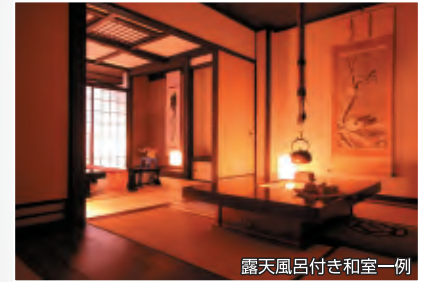
露天風呂付き和室一例