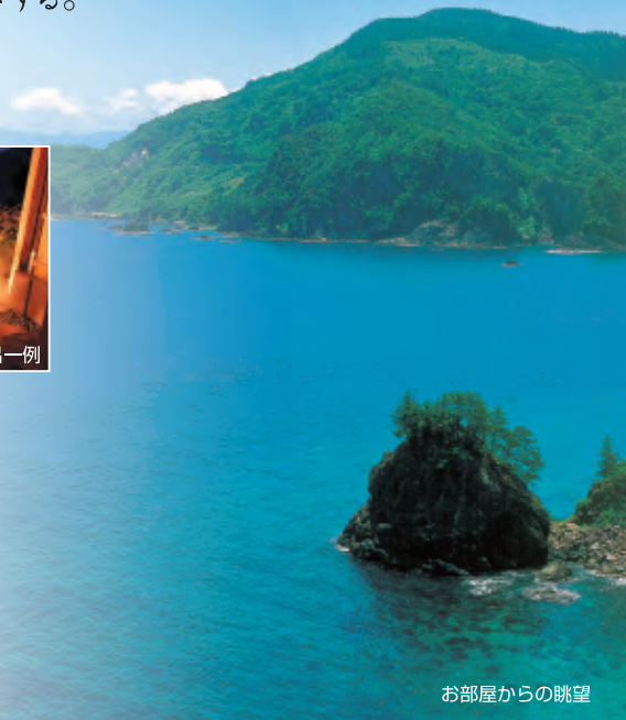
お部屋からの眺望