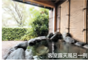
客室露天風呂一例