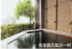
客室露天風呂一例