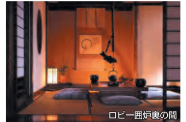
ロビー囲炉裏の間