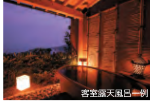
客室露天風呂一例